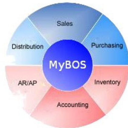
Paket Modul MyBos

Mengingat keseluruhan modul dari sistem perusahaan merupakan satu kesatuan database, maka begitu ada transaksi secara otomatis sistem akan terupdate sampai dengan sistem keuangan. Kemampuan dalam update otomatis ini meningkatkan akurasi dari laporan keuangan. Konektifitas dengan GL memberikan kemudahan dalam melacak transaksi secara detail sehingga dapat diverivikasi dan dianalisa secara cepat demi kepentingan eksternal dan internal audit.